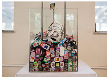
写真:「押せん地域」 アゼロ・ワセア作 夏の展示会の一部

この3年間で、彼は2つの新しい芸術学部に着手した。その2つとはデジタルグラフィックと映画である。デジタルグラフィックでは94人の生徒が受験した。このうち53人が女性で、これはどの学部よりも高い数値となった。