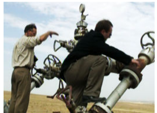
写真: アフガニスタンの地質学者がバルカ州に埋まっている天然資源発掘のために国際団体と共に作業

アフガニスタンを通る中央アジアから南アジアに繋がるパイプラインを延長することに合意する意向を鉱山産業省が示した。(次のページへ続く)