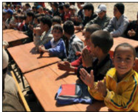
写真: 教育省によると、750万のアフガニスタンの子供が1200もの学校で勉強している。

教育省は高校生用のさらなるカリキュラム改正を検討している。高校で使われる教科書は早ければ来年にも印刷・配布される予定だ。