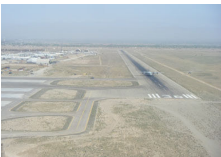
写真: ヘラート国際空港 :

現在、国際線が運航しているのはカブール、カンダハール、マザーリシェリーフとなっている。