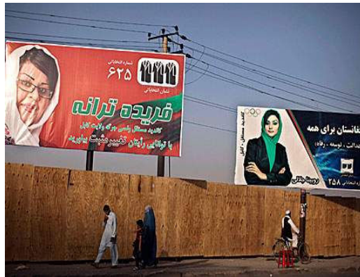
写真: 選挙活動ポスター