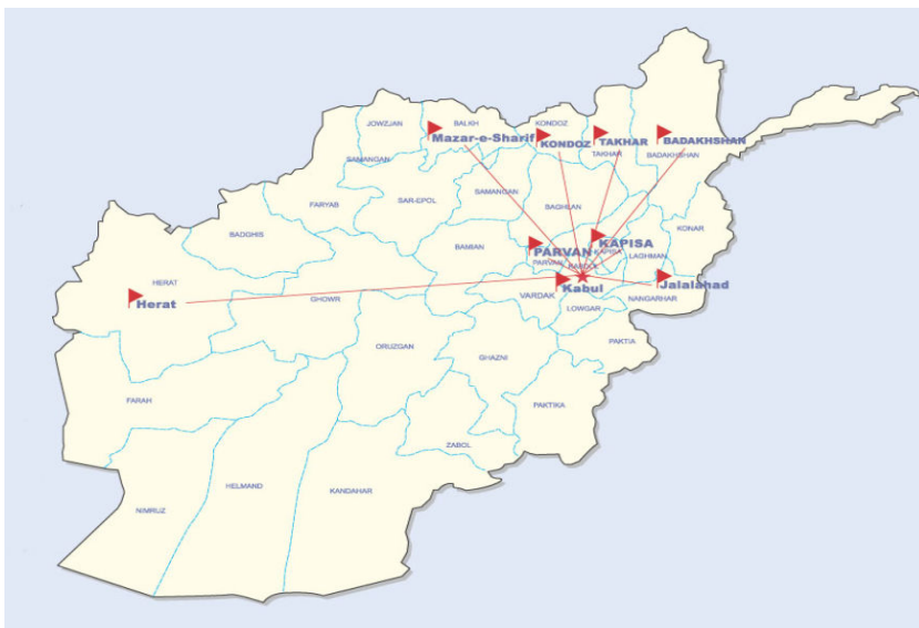
地図：ハリロッド建設会社は現在アフガニスタン国内10箇所にある。牧氏は全てに下請けとして関わっている。

アフガニスタン復興に協力出来る技術を持った会社、及び個人業者の方々に危険な場所というイメージを早く拭い去り、一度カブールへ出向き、肌で実感される事をお勧めいたします。