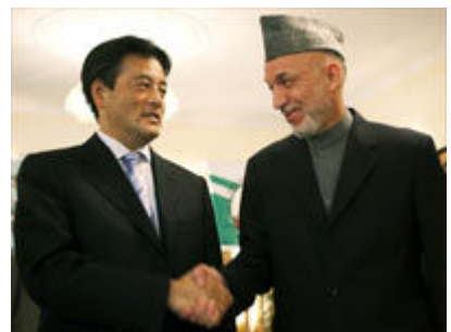
写真: 岡田外相とカルザイ大統領