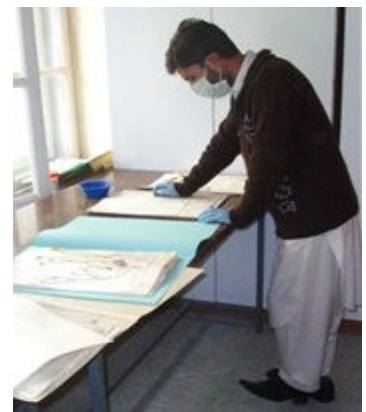
カブール大学にて、植物標本の1ページを修復する学生。

植物標本室は今後、政府と大学との開発プログラムの設計、実行と管理努力をサポートするために役立てられる。復興コーディネーターによると、新しい植物標本室データベースは以前不可能だった完全な環境のインパクト査定を可能にできる。更に、特定の地理エリアに対して天然資源管理と復興手順を